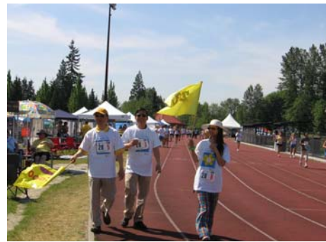
千禧龍 Dragon 2000 的雄姿